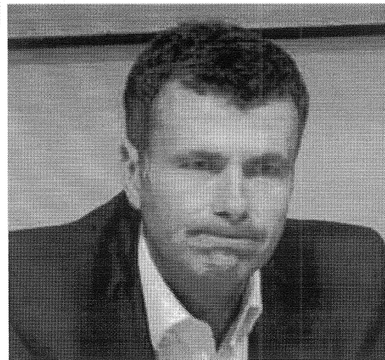
L'ASSESSORE REGIONALE ALL'ECONOMIA, ALESSANDRO BACCÉI

Tra le somme congelate, ci sono i 173 milioni destinati a co-finanziare i progetti previsti dalla programmazione europea 2014-2020: circa 100 milioni per i lavoratori della forestale e dei consorzi di bonifica e così via. Se non dovessero arrivare, o arrivassero per un qualsiasi motivo in ritardo, i 550 milio-