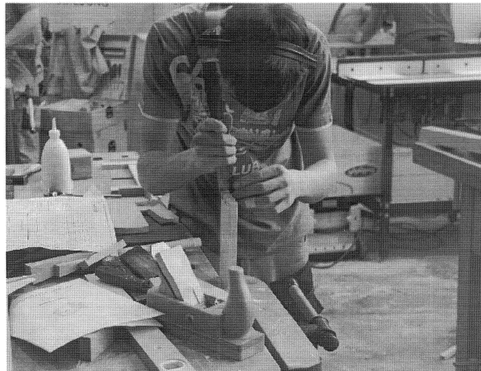
Secondo le stime dell'assessorato alle Attività produttive, alla Crias serve un sostegno strutturale di 50 milioni di euro