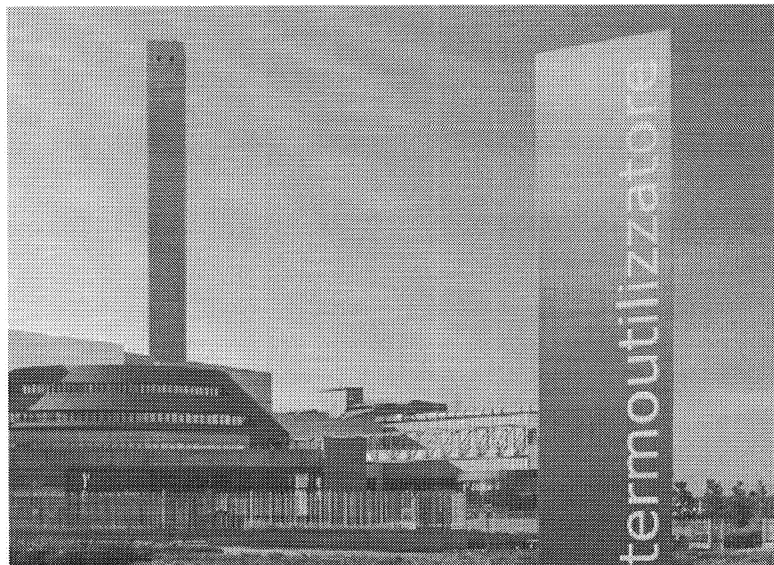
Secondo il documento della Conferenza Stato-Regioni, la Sicilia ricorre quasi esclusivamente allo smaltimento in discarica