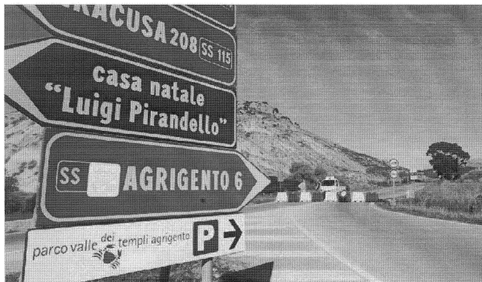
L'ingresso della Panoramica, dalla Rotatoria del tempio di Giunone

«Entro domani (oggi ndr) pomeriggio - si legge in una nota - dovrebbe essere completata la bitumatura dei tratti scarificati, e solo a quel punto sarà possibile riaprire al traffico la SP 4, importante tassello nel reticolo viario intorno alla città, la cui chiusura ha