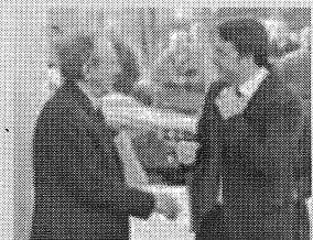
PIER CARLO PADOAN E MATTEO RENZI

Slitta ancora il decreto sulle banche governo diviso